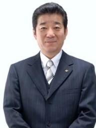
大阪府知事 松井 一郎